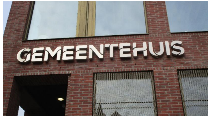
Foto 4: Noteer de titel van het lied van de bekende Wetterse zanger die we straks nog zien, zoals vermeld op het plein waartoe dit gebouw behoort.