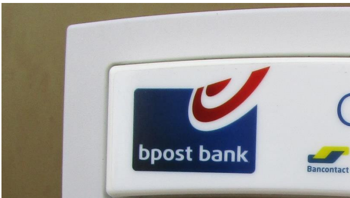
Foto 5. Zet een hier te lezen woord in hoofdletters en plaats de laatste vier vooraan en je noteert de artiestennaam van een zanger. Noteer ook de naam van die zanger (tip: onze webmaster is geen familie).