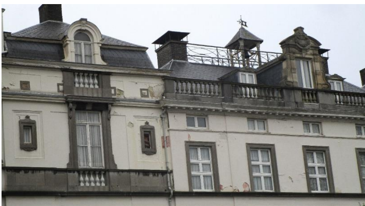
Foto 15. Noteer het adres van dit kasteel van de ex-burgemeester van Wetteren burggraaf Charles Hyppolite Vilain XIII (tip: huisnummer op de kapel)