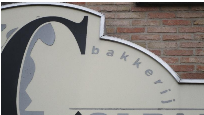
Foto 21. Van welk woord, vet in Prisma, kan je de meervoudsvorm scrabbelen met 7 letters van de (familie)naam van de bakkerij? (1 antwoord).