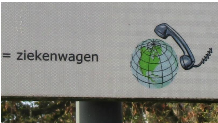
Foto 11. Welk telefoonnummer staat er op dit bord aan de zijkant van het gefotografeerde deel?