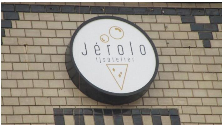
Foto 7. Welk dier is er afgebeeld op of aan een gebouw behorend tot de Markt? MA: vleermuis-muis-vos-stier-haan-schaap.