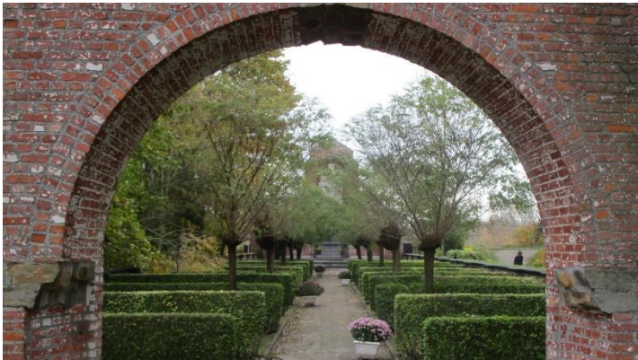
Foto 3. Noteer de som van de Romeinse getallen, op dit kerkhof op een muur vermeld, als een Romeins getal. Noteer ook die som als een Arabisch getal.