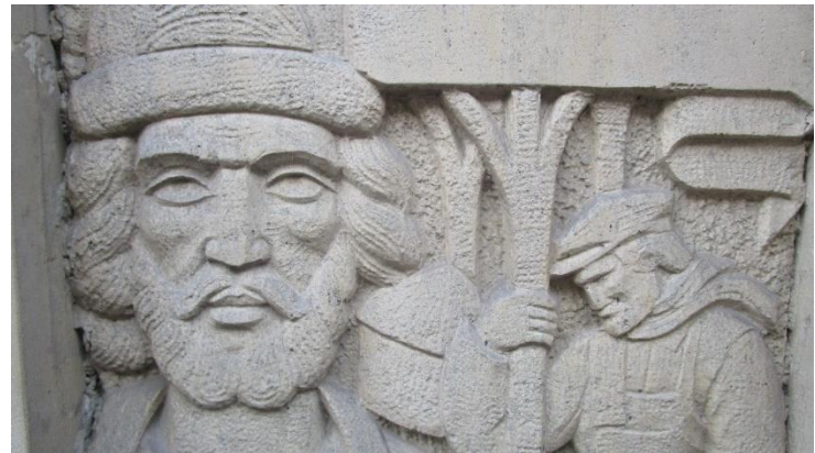
Foto 20. Welk gegeven is er hier afgebeeld op de muur van dit gebouw? MA: kruiwagen - paardenmiddel - rook - kruisteken - paardenmolen - kerkfabriek.