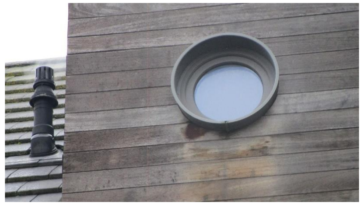
Foto 10. In welke straat stond de fotograaf bij het nemen van de foto, volgens gegevens ter plaatse in die straat, vermeld op het straatnaambord?