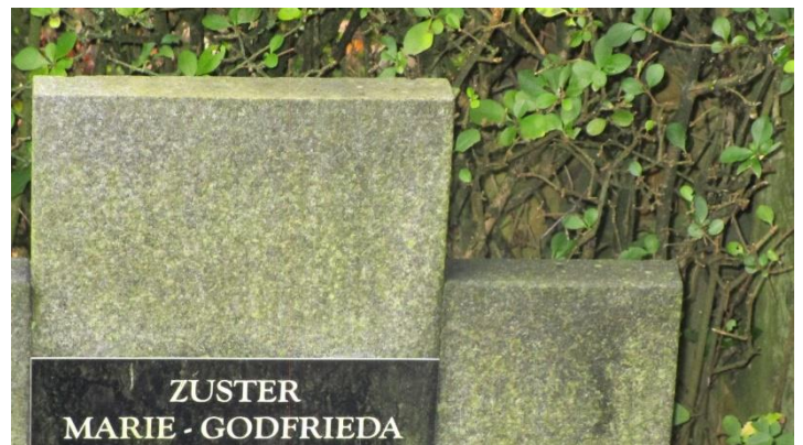
Foto 14. Welke naam van een ziekte (P) kan je vormen met het meest aantal letters van de naam van deze zuster (met initialen C B)? Noteer ook haar bijnaam, volgens gegevens (niet de kloosternaam).