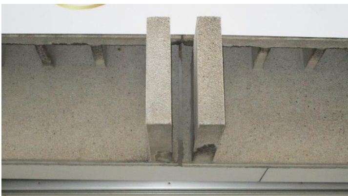
Foto 23. Welk woord volgt er hier boven het gefotografeerde onmiddellijk op "BEAUTY"?