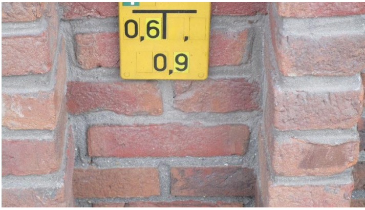
Foto 17. Noteer de naam van de onzichtbare stof in ijle toestand die hier aanwezig is (tip: de naam bevat maar 1 klinker- 2 antwoorden)