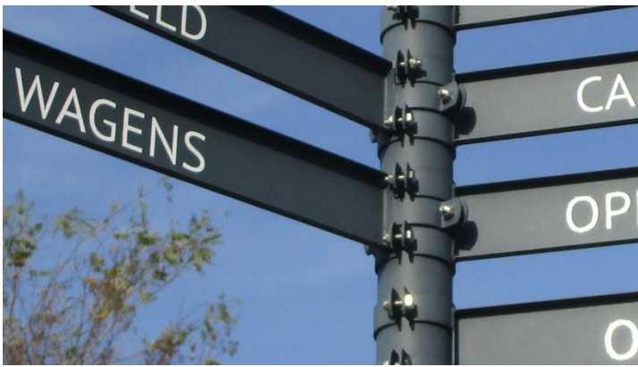
Foto 9. Welk woord, vermeld op of aan deze paal met wegwijzers, betekent 'onoverzichtelijke toestand'? (1 antwoord).