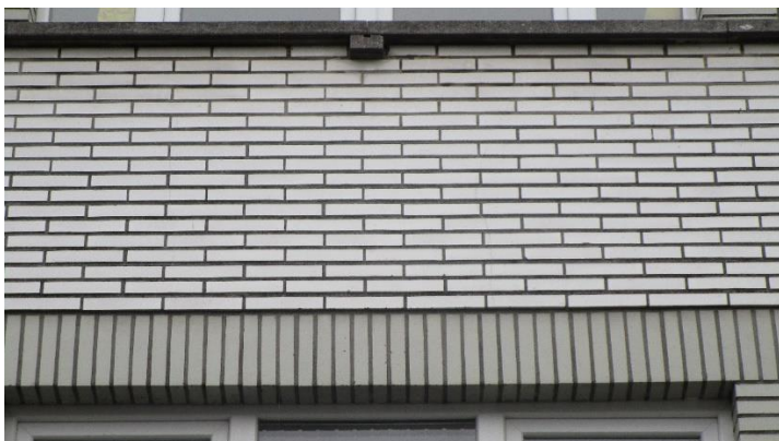
Foto 13. Noteer het getal dat hier verkleind genoteerd staat naast het huisnummer 18, als aanduiding van een appartement van dit gebouw, waarvan de som der cijfers een drievoud is.