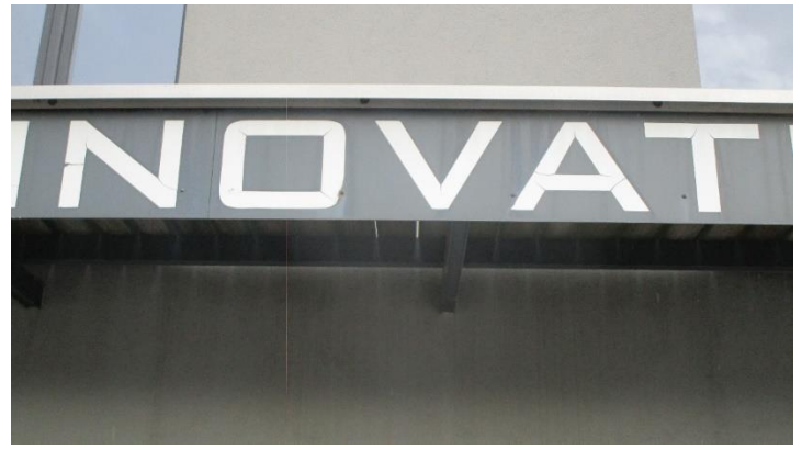
Foto 18. Welk voorwerp waarvan enkel een klinker 'A' in de naam voorkomt is hier afgebeeld? MA: kam - hoorn - lamp - schaar.