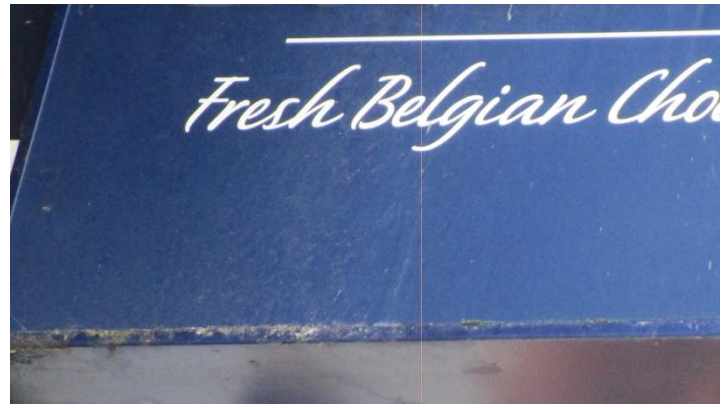
Foto 2. Noteer de naam van de Griek en tevens de in een woord verscholen dieren naam op dit bord.