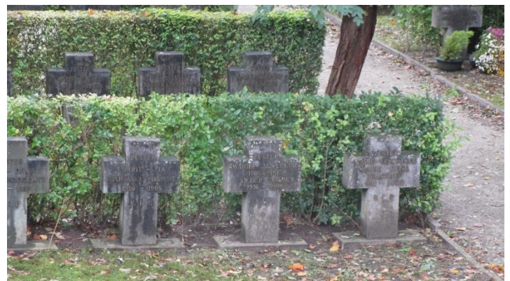
Foto 8. Welk woord, meer dan 12 cm hoog, dat begint met de letter 'D' is vermeld op of aan dit kerkhof? (niet zoeken op de Apostolinnen-graven).