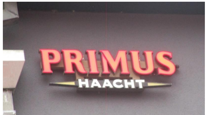
Foto 22. Cryptisch: het laatste glaasje tot besluit van de zoektocht met een te wijde broek. Wat bedoelen we? (antwoorden met 1 woord vg).