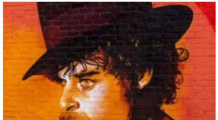
Foto 6. Met 3 letters uit de naam van de ster (persoon) afgebeeld in het startcafé kan je de naam van een dier vormen beginnend met de letter 'R'. Welke naam van een dier kan je zo vormen vg (P)?