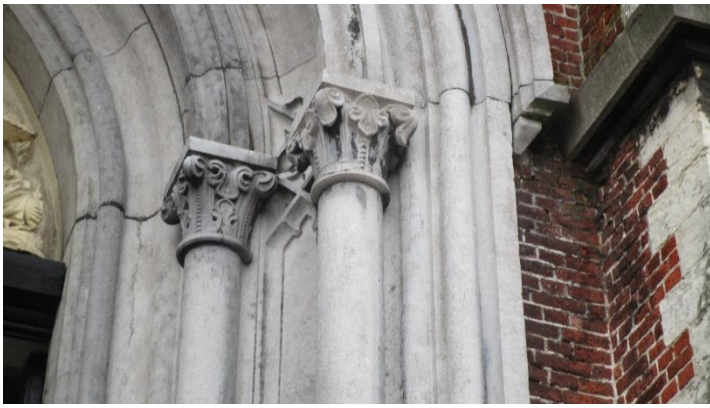
Foto 1. Van welke 3 elementen, alfabetisch te noteren, is RUNDBOGENSTIL een combinatie vgtpt?