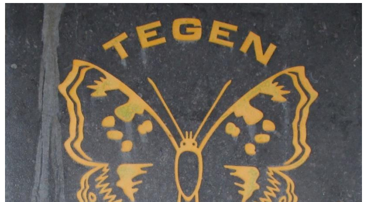
Foto 12. Welk woord, beginnend met de letter 'Z', is hier vermeld?