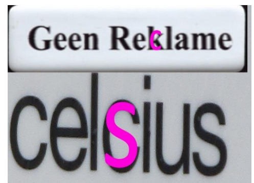
Foto 22: Onder het gefotografeerde bevinden zich 2 verschillende medeklinkers in een blauwe kleur. Indien we 1 of 2 klinkers toevoegen bij deze medeklinkers kunnen we een woord scrabbelen. Wat is een betekenis van het op deze manier bekomen woord?

Naast de deur met het gefotografeerde lazen we in grote letters de naam van het bedrijf 'CELCIUS' en op de brievenbus vonden we op een sticker het woord 'REKLAME'. Geen probleem met dit laatste, in de huidige spelling moet dit woord met een 'C' geschreven worden, dus 'k' door 'c' vervangen was al zeker juist. We hadden meer problemen met "CELCIUS". Het moet uiteraard "CELSIUS" zijn maar in de vroegere spellingsregels werd dit woord ook zo geschreven. Beantwoordde dit dan aan de vraag? Het is geen woord dat niet meer correct is maar altijd foutief was. We hebben daar echter geen val in gezien en ook het antwoord 'c' door 's' geantwoord, wat ook moest gegeven worden.